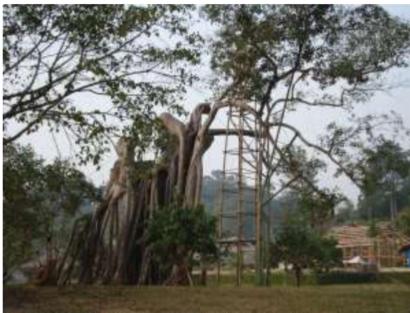
Cây đa Tân Trào

Trước đây, cây đa Tân Trào gồm 2 cây mọc cách nhau khoảng 10 mét. Dân trong vùng quen gọi là “cây đa ông” và “cây đa bà”. Theo thời gian và ảnh hưởng của thời tiết, cây đa Tân Trào già cỗi. Tỉnh Tuyên Quang và Viện Khoa học Lâm nghiệp Việt Nam đã chiết cành của cây để lưu giữ gen và tạo rễ cho cây. Đồng thời chống đỡ thân cây bằng hệ thống cốt thép móng bê tông, bọc vật liệu tổng hợp, liên kết thân cây bằng đai thép.