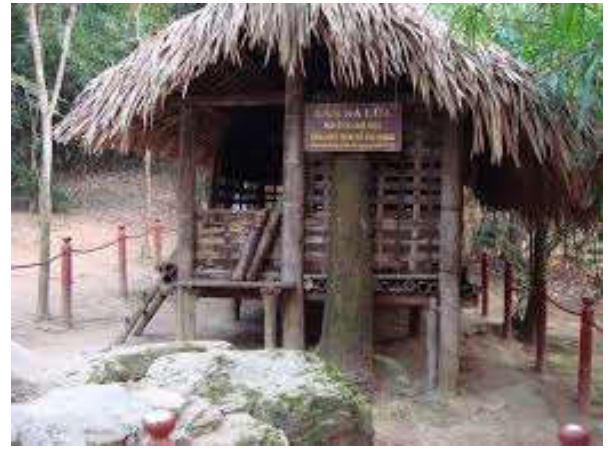
Lán Nà Lừa

Lán Nà Lừa là một căn lán nhỏ, nằm ở sườn núi Nà Lừa - kiểu nhà sàn của người miền núi, dưới các tán cây rậm rạp bảo đảm bí mật và đáp ứng các yêu cầu của Bác Hồ đề ra là: “gần núi, gần dân, xa đường quốc lộ, thuận đường tiến, tiện đường thoái”.