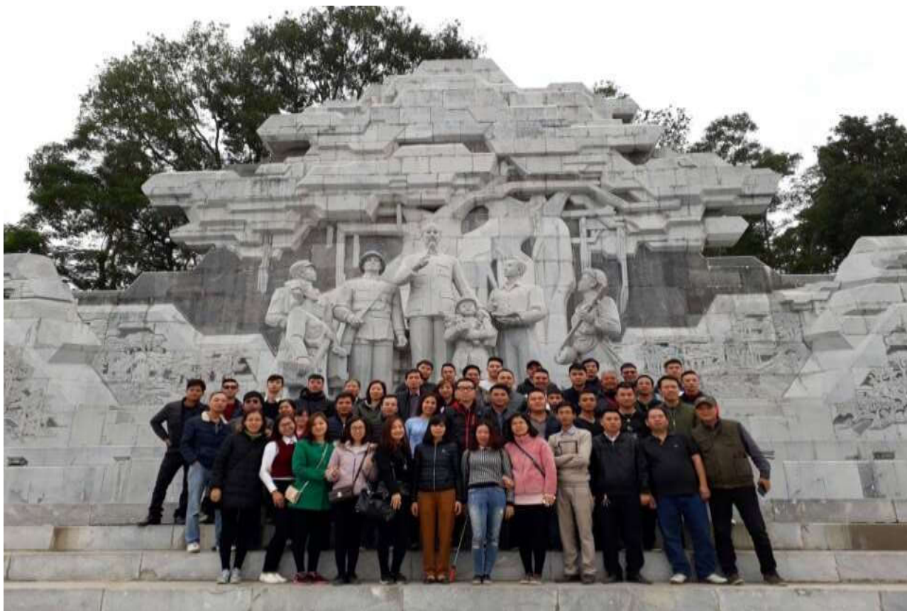
Trong chuyến du xuân tại Tuyên Quang, đoàn CBCNV Công ty Taxi ABC đã chụp ảnh lưu niệm trước tượng đài “Bác Hồ với nhân dân các dân tộc tỉnh Tuyên Quang”