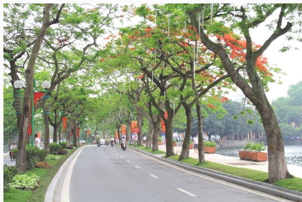
Đường Thanh Niên

Trúc Bạch với Hồ Tây. Thời Pháp thuộc gọi là đường thông chế Ly-ô-Tây (Rue Marechal Lyantey). Hồi đó chỉ là một con đường hẹp, lòng đường không quá 4 mét. Sau Cách Mạng ta gọi là đường Cổ Ngư. Trong hai năm 1958 - 1959, đông đảo thanh niên, học sinh Thủ đô đã tới đây lao động, đắp cao và mở rộng đường này. Bác Hồ đã đến thăm công trường và gợi ý đặt tên là đường Thanh Niên. Khi công trình hoàn thành, Ủy ban hành chính thành phố (nay là UBND thành phố) đặt tên là đường Thanh Niên cho đến nay.